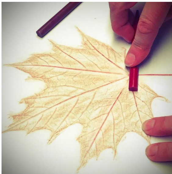
Paprastasis klevas / Norway maple

Medžių lapų atspaudų ir vaisių bei sėklų nuotraukų pavyzdžiai (vaisių ir sėklų kompozicijas fotografuoti galima ant bet kokios spalvos fono):