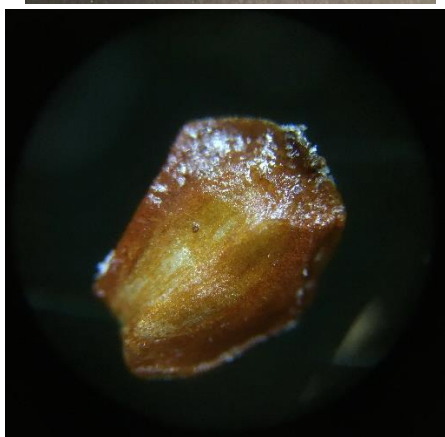
Baltalksnis / Grey alder