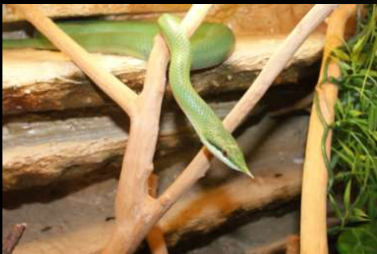
Vietnamo vienaragė gyvatė