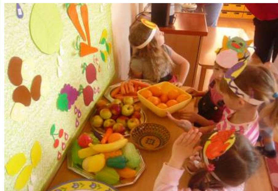
Atvira veikla „Stebuklingas vitaminų pasaulis“