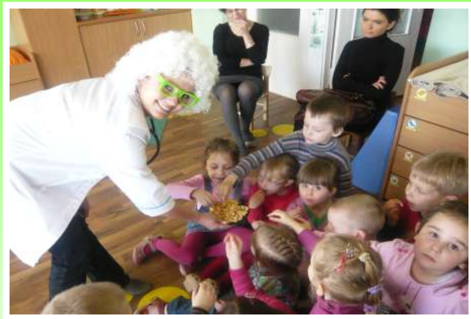
Rytmetys „Maitinkis sveikai“